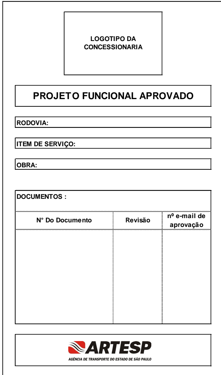
Etiqueta de identificação na parte frontal da Pasta ou Caixa Box