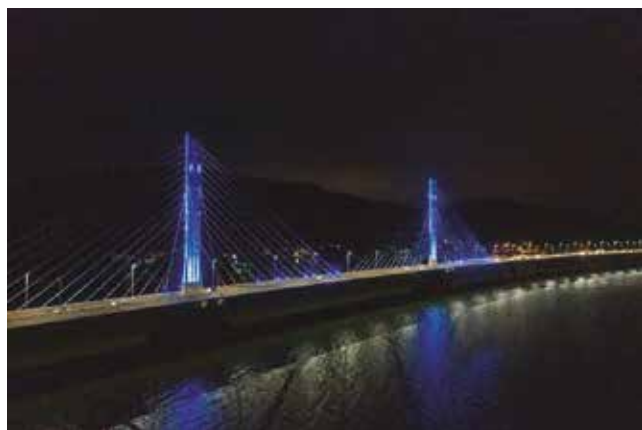
Em alusão a campanha do Novembro Azul, a ponte Anita Garibaldi trocou sua iluminação para reforçar sobre a importância do exame preventivo contra o câncer da próstata.

VEJA A LOCALIZAÇÃO DE CADA UMA DAS BASES E PRAÇAS DE PEDÁGIO: